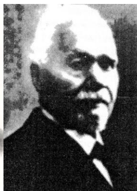
CONSTANTIN DIMITRESCU- SEVEREANU (1840-1930)