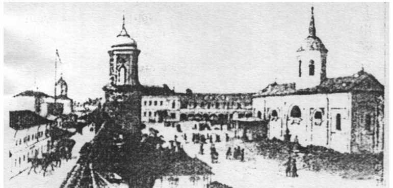
Hopital Sfântul Spiridon (1731), Iassy