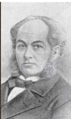
CAROL DAVILA (1826-1890)