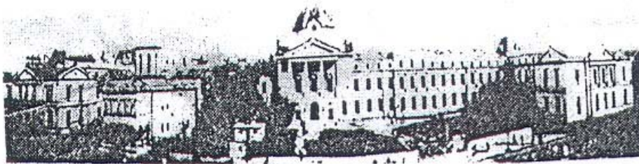
Hôpital Coltzea (1704)

Pendant une séance de l'Union des Nations, Nicolas Titulescu disait: "Quand il s'agit de la France et de la Roumanie, il est difficile de séparer le coeur et la raison".