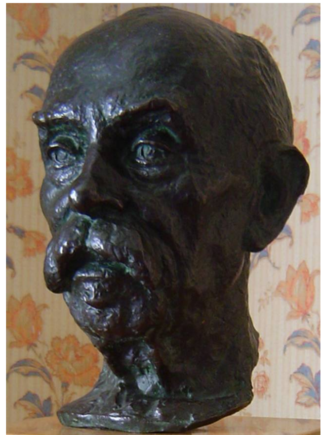
Fig 8 Buste d'Arsène d'Arsonval