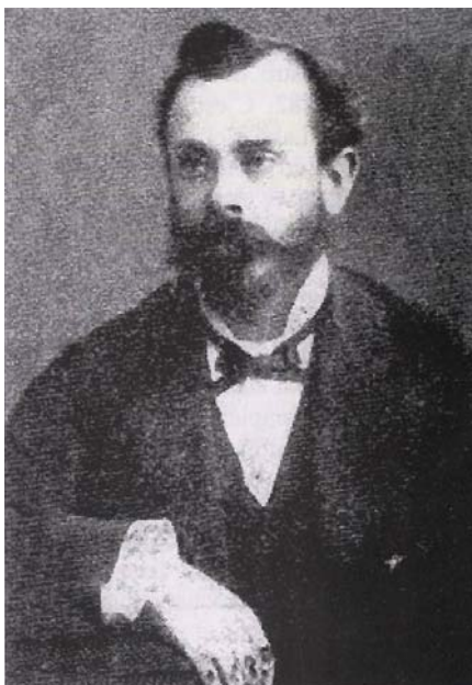
Fig. 2 Arsène d'Arsonval à 32 ans