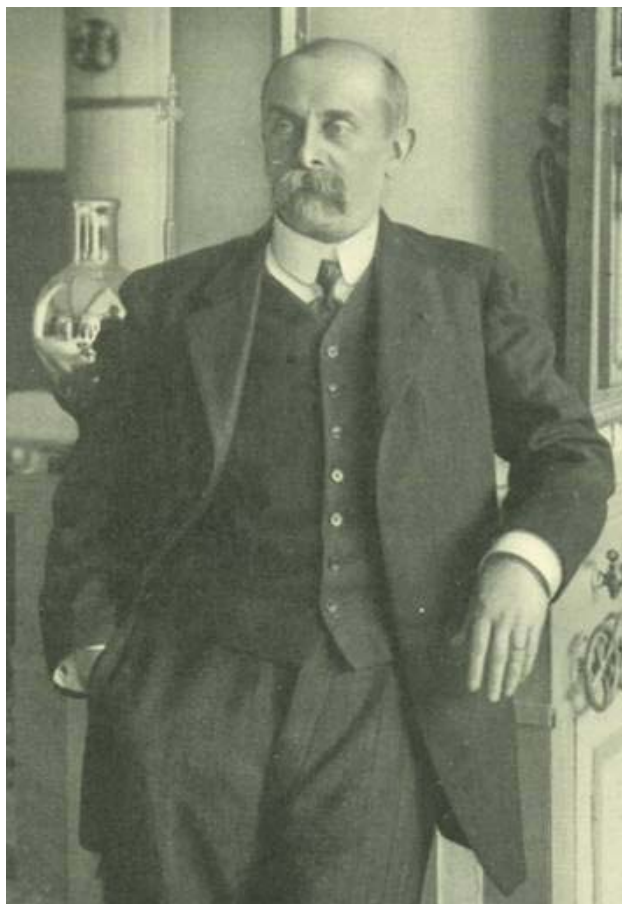
Fig 7 Arsène d'Arsonval dans son laboratoire

Ainsi Portant un toast à Kamerling-Onnes, Prix Nobel en 1913, il dit : "Le gentleman du zéro absolu" et il conclut son discours par "De l'utilité des expérimentations inuti-