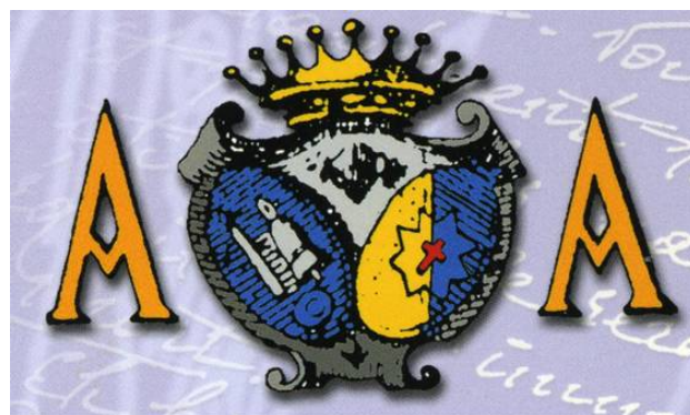
Fig. 9 Armoiries d'Arsène d'Arsonval

Le père, Pierre Catherine décède en 1883 à La Borie, en lisant la lettre annonçant la proposition de son fils pour une croix dans l'Ordre national de la Légion d'Honneur. La délicatesse d'Arsène apparaît là encore, puisqu'il laisse cette lettre dans les mains roides de son père pour la mise en bière car il était en train de la lire au moment de sa