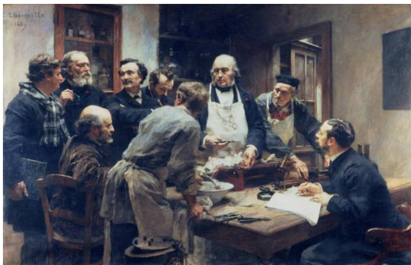
Fig 3 Le Caveau, Laboratoire de Claude Bernard. Peinture de Lhermitte Académie nationale de Médecine