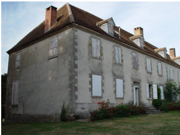
Fig 1 La Borie

dont il fut grand croix, admis comme bienfaiteur de l'humanité. Sans descendant direct à son décès, il lègue son patrimoine au Collège de France dont il a été professeur titulaire de la chaire de Médecine pendant 38 ans.